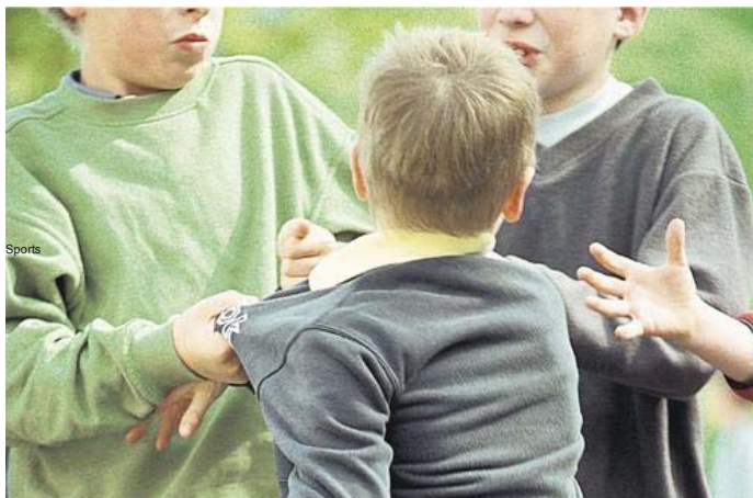
L'Education nationale souhaite « Apporter une protection maximale aux établissements scolaires et aux victimes de violences. » MixPPP

L'Education nationale lance lundi une enquête inédite dans les collèges. Une opération vérité contre le harcèlement subi par des milliers d'élèves.