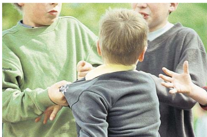
L'Education nationale souhaite « Apporter une protection maximale aux établissements scolaires et aux victimes de violences. » MixPPP

L'Education nationale lance lundi une enquête inédite dans les collèges. Une opération vérité contre le harcèlement subi par des milliers d'élèves.